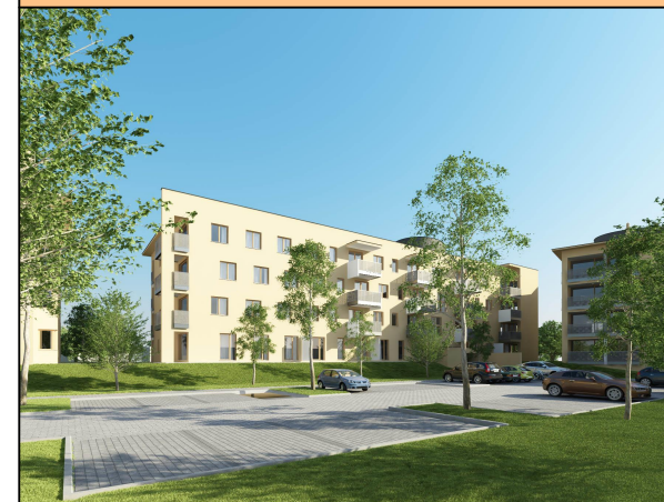
POŁOŻENIE BUDYNKU W ZESPOLE